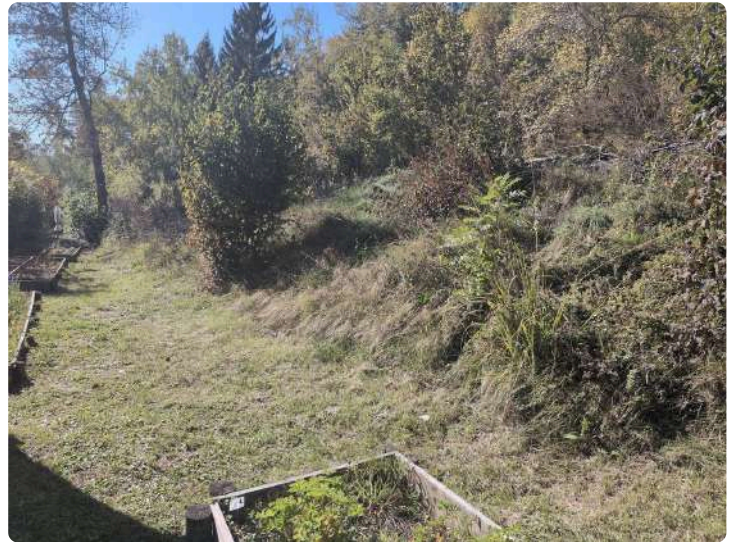
Talus du jardin aromatique (en cours d'aménagement)