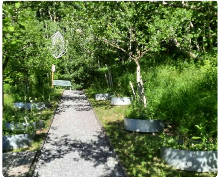
Porte du Soleil