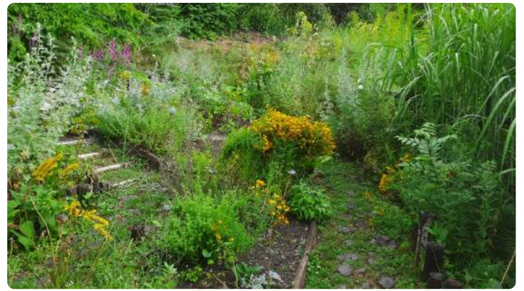
Emplacement du futur Jardin de Feuillages