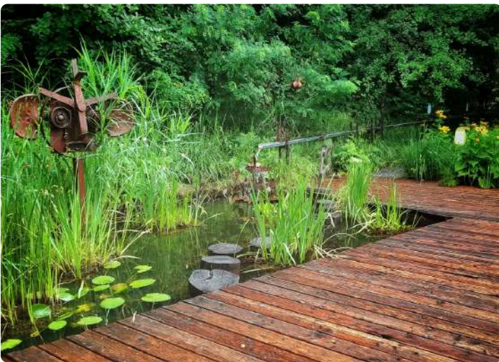
Porte des Miroirs