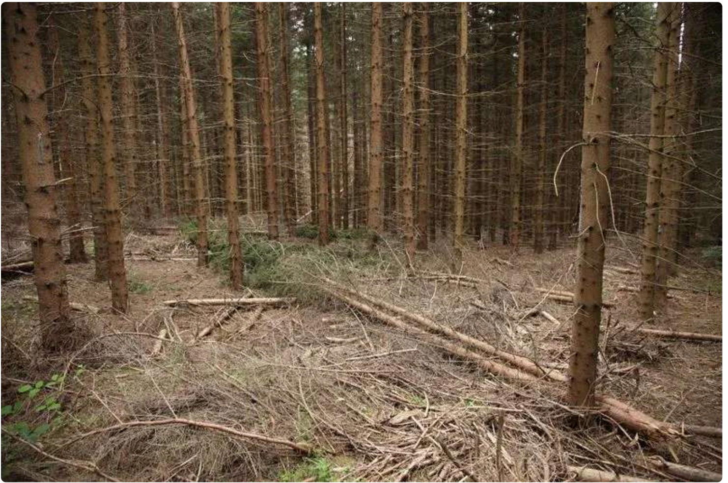
Exemple plantation d'épicéas

En complément des espaces naturels, certains jardins et espaces scénographiés du parcours peuvent également accueillir une proposition, en fonction des contraintes paysagères, de la thématique du jardin ou de l'espace, des contraintes techniques et de cohabitation avec la visite. Ces espaces étant généralement plus contraints (moins de place, circulation du public), la proposition devra s'intégrer au mieux au sujet et à l'identité du lieu.