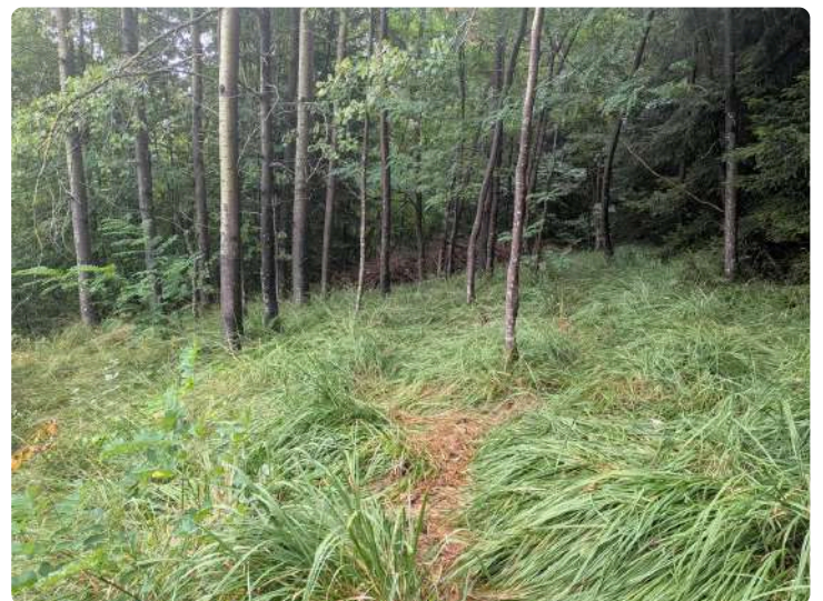
Exemple de forêt mixte - Jardin des Cimes