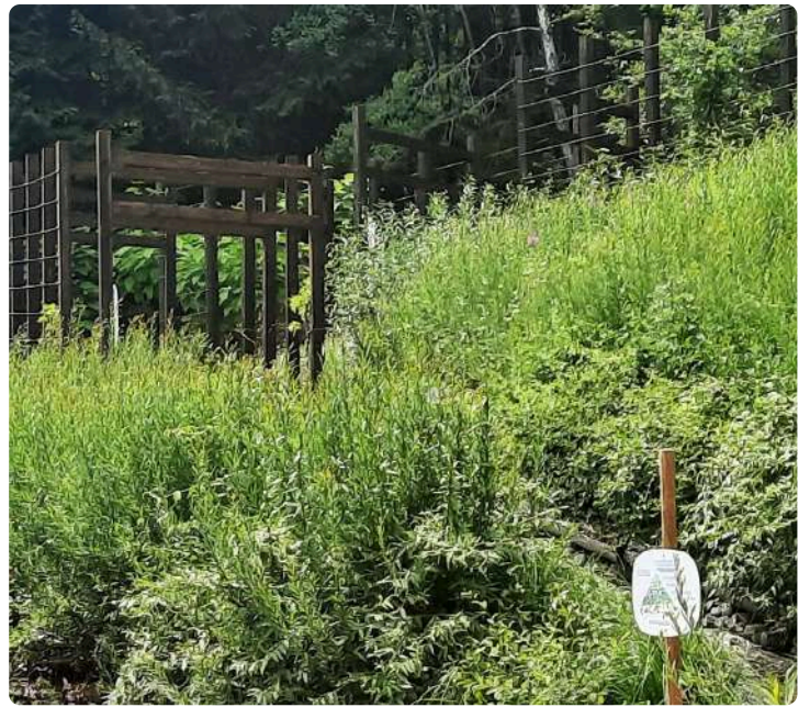
Porte de l'Ombre