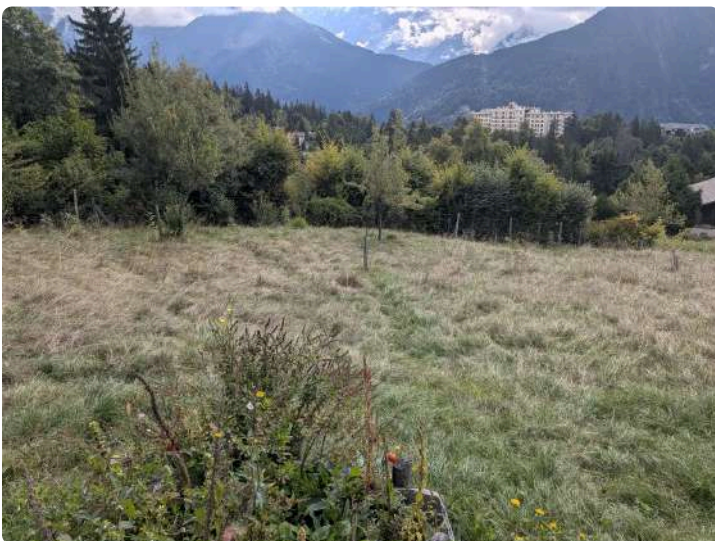
Exemple de prairie - Jardin des Cimes